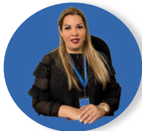
Abg. Blanca S. Izaguirre Comisionada Nacional de los Derechos Humanos